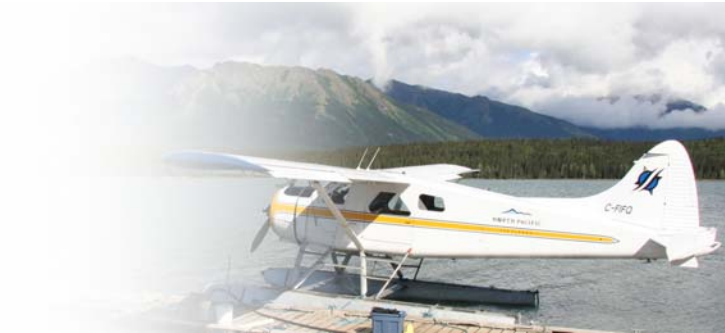
Global Forest Watch Canada 10th Publication d'Anniversaire #2

Citation: Lee PG, Hanneman M, Gysbers JD, Cheng R. 2010. L'accès cumulative au Canada dans les écozones boisé Edmonton, Alberta: Global Forest Watch Canada 10th Anniversary Publication #2. 7 pp. Disponible à: www.globalforestwatch.ca .